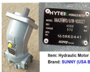
Item: Hydraulic Motor Brand: SUNNY (USA Brand)